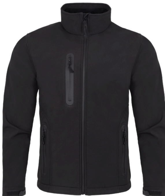
Front der Jacke SLRA 8000 – schwarz